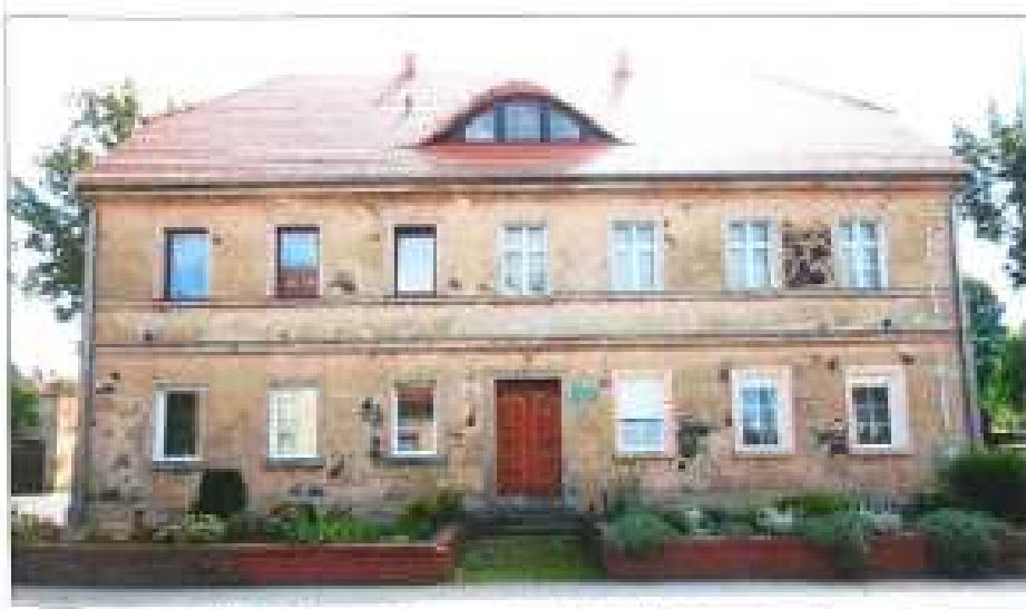
Widok elewacji frontowej- ul. Armii Krajowej nr 27.

na sprzedaż lokalu mieszkalnego Nr 5, znajdującego się w budynku położonym w Lubaniu przy ul. Armii Krajowej 27 wraz z udziałem we współwłasności nieruchomości gruntowej (działka nr 61, AM 19, Obręb II o powierzchni 757 m 2 , JG1L/00027175/2)